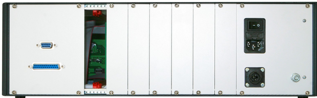
Рис.3. Вид задней панели многоканального приёмника

Внешние разъёмы и линии для установки приёмных модулей расположены на задней панели приёмника. Вид задней панели представлен на рис.3. Назначение пояснены надписями.