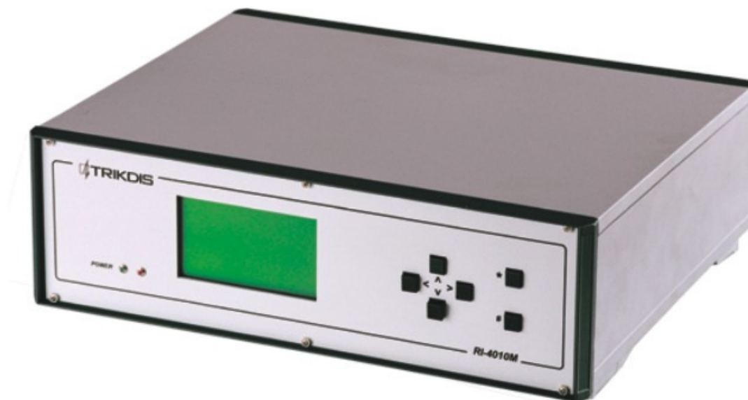
1. Общий вид многоканального приёмника

Приёмник состоит из базы и встраиваемых в неё приёмных модулей. База обеспечивает питание само устройство и приёмные модули, управляет потоками данных, обеспечивает индикацию сообщений и передачу данных на программу наблюдения. Также принятую информацию можно отпечатать. В базе установленные приёмные модули принимают и опознают сигналы, передаваемые с абонентных устройств по разным каналам связи.